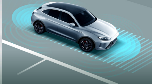
خودران سطح ۲ با سیزده دستیار کمک راننده