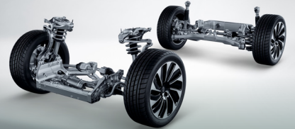
سیستم تعلیق جناقی دابل چهار اتصالی کمبر متغیر